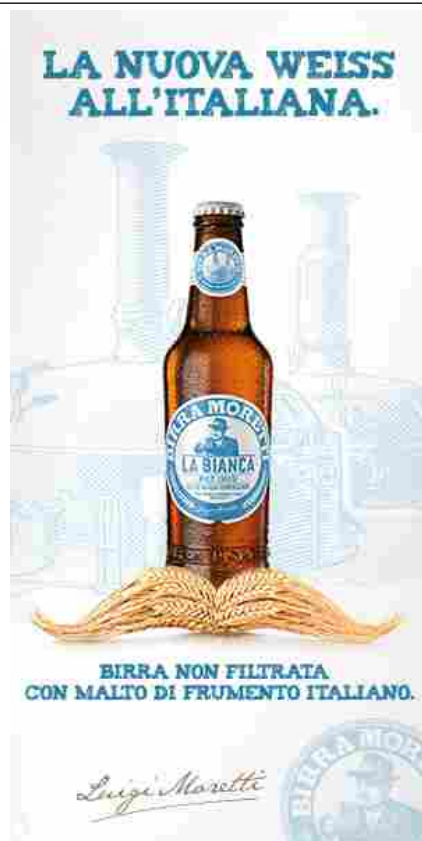
FOTO E VIDEO